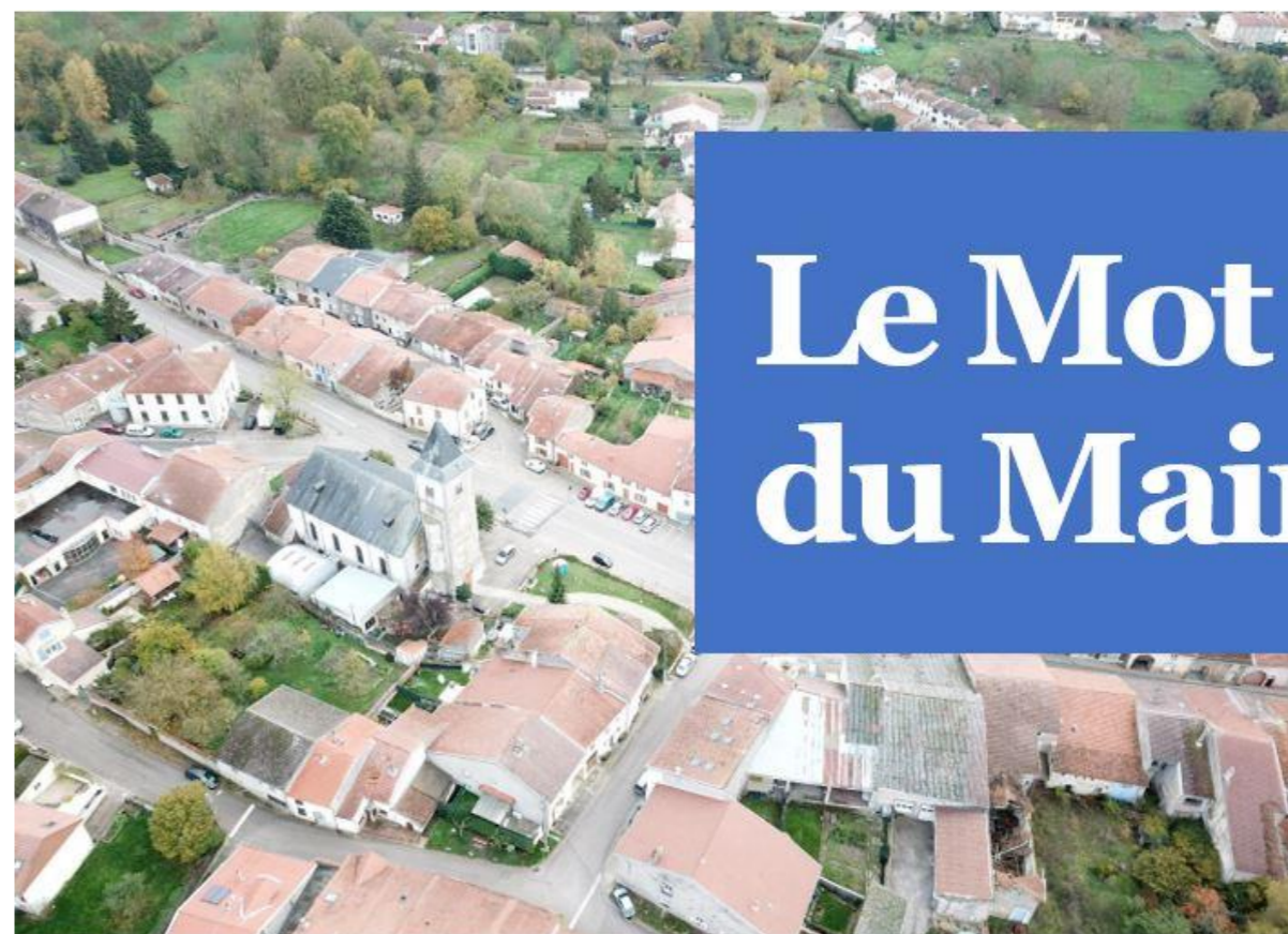
Ceintrey vu du Ciel